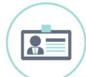
Investigadores y emprendedores