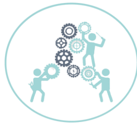
Organismos de apoyo