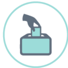
Asamblea general de socios