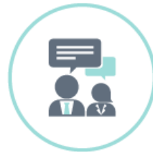
Encuentros de negocio